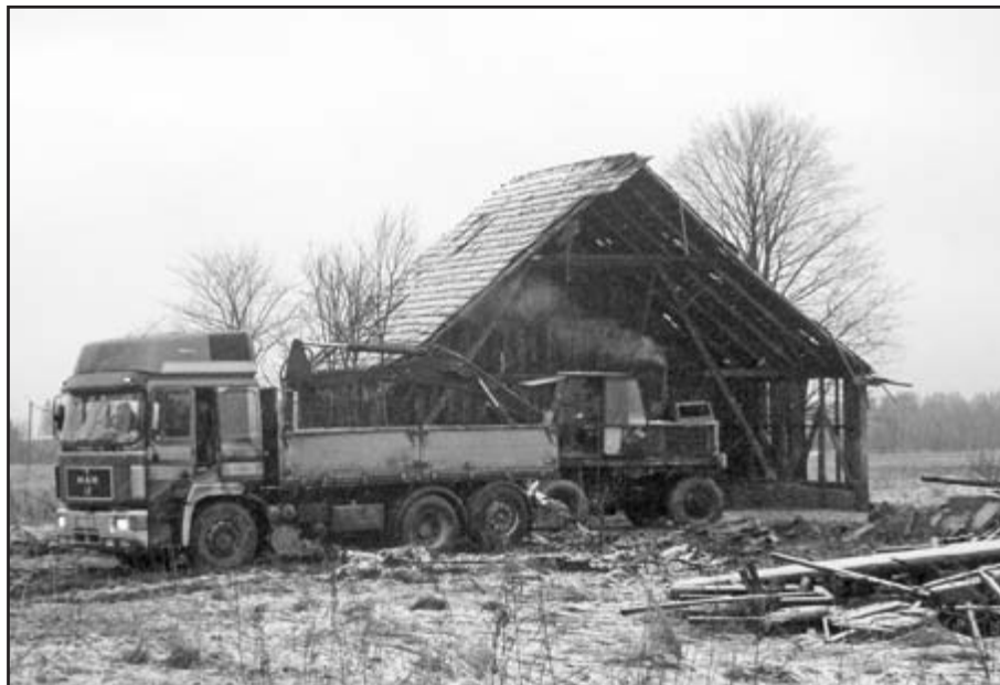
Väetis asus varisemisohtlikus hoones, mille lammutamine oli võimaliku reostuskolde likvideerimistöde esimene etapp.

Keskonnaohtliku väetiseküüni likvideerimist toetas 50% ulatuses SA Keskkonnainvesteeringute Keskus, kus kiideti heaks 2008. aasta taotlusvooru esitatud projekt. Taotlust rahastati keskkonkaitseliste tegevuste toetamiseks avatud