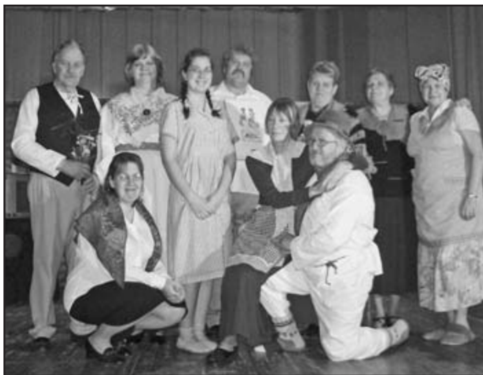
Piirsalu külaseltsi näitetrupp. Ene Kanguri foto

Raikküla valla kultuuritöötaja Ene Kangur