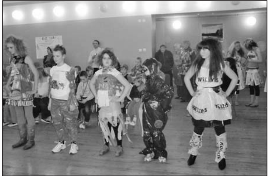
Näide laste loovast lähenemisest.